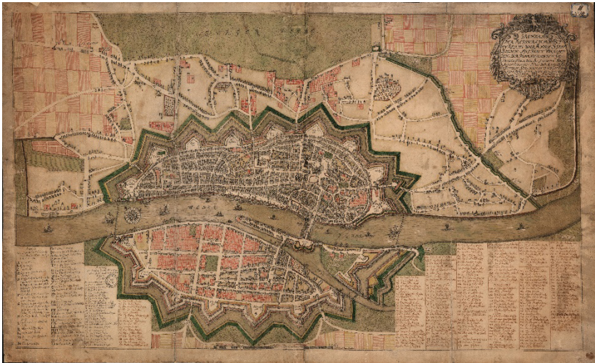
Karte 1: SuUB kt_mappe_iii_10