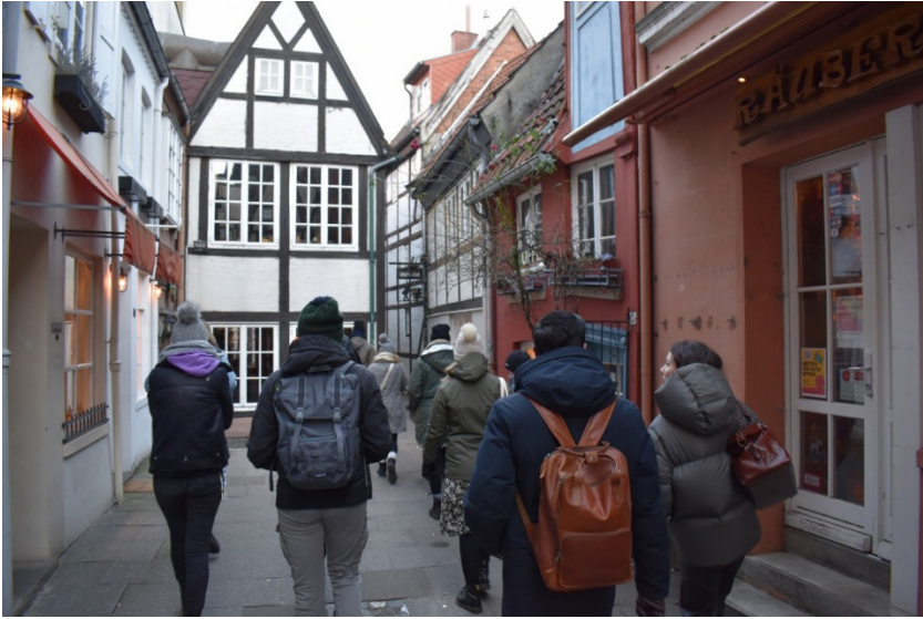
Abb. 1: Realprobe im Bremer Schnoorviertel

Da aus Zeitgründen nicht alle Stadtteile Bremens bearbeitet werden konnten, wählten die Studierenden die aus ihrer Sicht spannendsten aus – die Entscheidung fiel auf die Erhebung von Straßennamen aus den alten Innenstädten, also Alte Neustadt und Altstadt, sowie Huchting. 2 Die Namen aus diesen Vierteln wurden im Rahmen des Seminars erhoben und mit den zugehörigen Informationen wie Lage/Nutzung und eventuell auch historischen Belegen in Listen sortiert. Die eigentlichen Namenartikel entstanden in einem anschließenden Blockseminar, an welchem sieben Studierende teilnahmen. Diese werteten als Prüfungsleistung die erhobenen Daten aus und erstellten eine Sammlung aus jeweils 45 Namen. Damit wurden für 315 Bremer Straßennamen Namenartikel nach einem vorgegebenen Format erstellt. Folgende Vorlage haben die Studierenden erhalten: